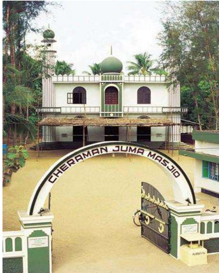
Masjid Cheraman Juma, dinamakan sempena muallaf pertama, Cheraman perumal Chakrawati Farmas selepas pembaikpulihan.

Penyaksian dan pertemuan Raja India tersebut dengan Nabi Muhammad juga telah diriwayatkan oleh sumber Muslim. Ahli sejarah Muslim yang terkenal, Ibn Kathir, menyebut tentang peristiwa bulan terbelah ini yang disaksikan di kawasan-kawasan di India. Juga, kitab-kitab hadis telah meriwayatkan kedatangan Raja India dan pertemuannya dengan Nabi SAW. Abu Sa'id al-Khudri, sahabat Nabi Muhammad SAW meriwayatkan :