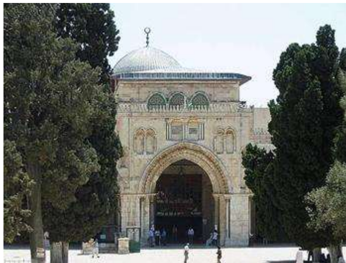
Pintu masuk Masjidil Aqsa di mana darinya Rasullah dimikrajkan.

Peristiwa ini turut disahihkan menerusi penyaksian sendiri yang diriwayatkan oleh perawi-perawi hadis yang dipercayai (hadis mutawatir).