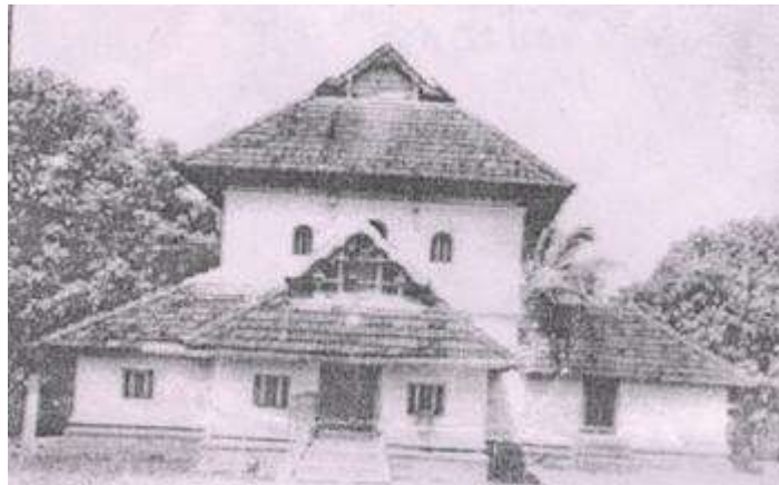
Gambar sebelum pembaikpulihan Masjid Cheraman Juma, masjid tertua India bertarikh 629 Sebelum Masihi.

Dikatakan bahawasanya kumpulan ini yang diketuai oleh seorang Muslim, Malik ibn Dinar, menyambung perjalanan mereka ke Kodungallure, ibu kota Chera, dan telah membina masjid pertama dan tertua India pada tahun 629 sebelum Masihi yang masih wujud hingga kini.